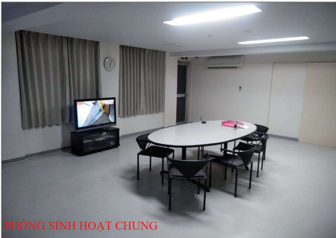
PHÒNG SINH HOẠT CHUNG