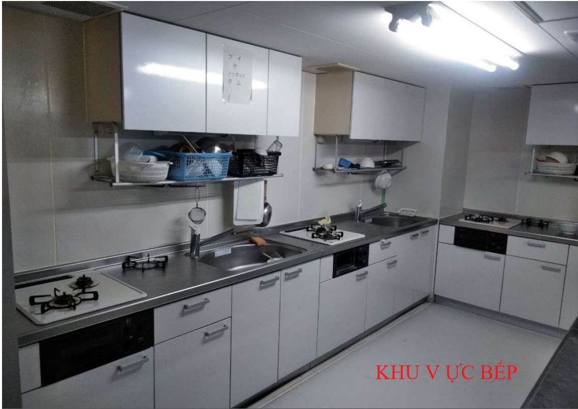
KHU V ỰC BẾP