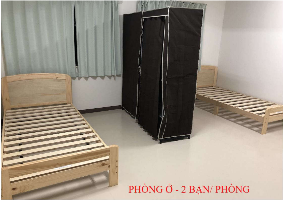
PHÒNG Ở - 2 BẠN/ PHÒNG